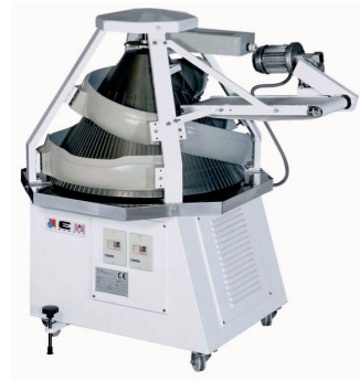
BC option TB 1