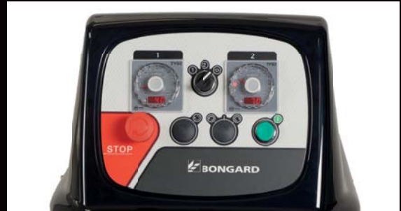
Commande électromécanique pour les modèles 50 et 70