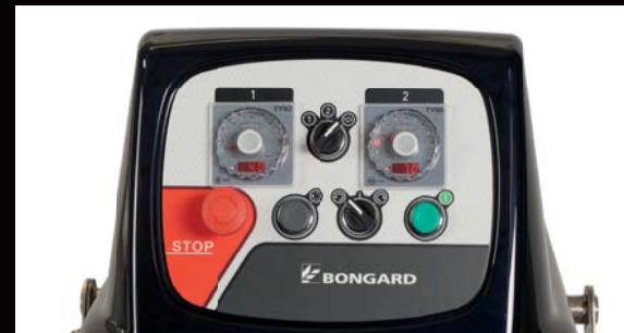
Commande électromécanique pour les modèles 80 et plus