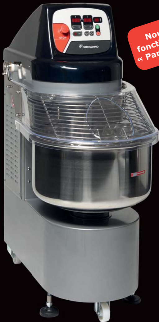
Spiral Evo 80 équipé du couvercle PMMA et de la grille de sécurité